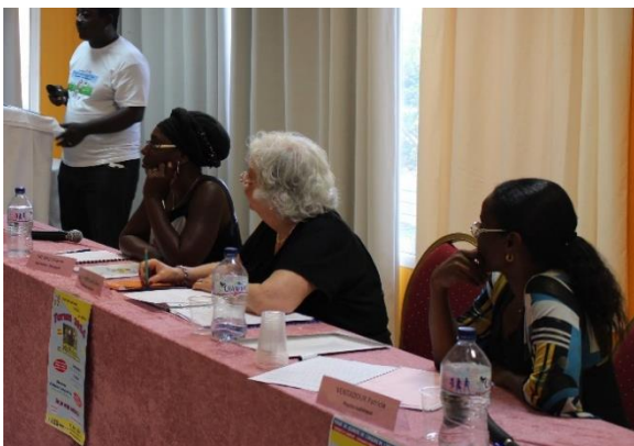
Conférence : Professionnels intervenant sur la thématique : « L'observation, un outil incontournable »