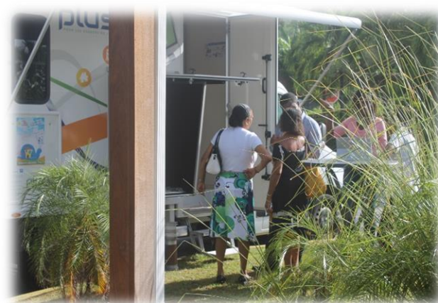
Stand extérieur : Véhicule PLUS "Pour les usagers du Sud" de l'Espace Sud , véritable bureau administratif mobile