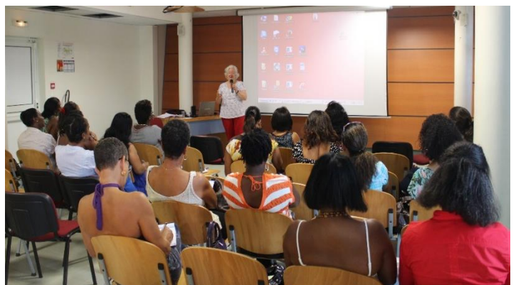
Atelier du samedi à la médiathèque de Rivière Salée