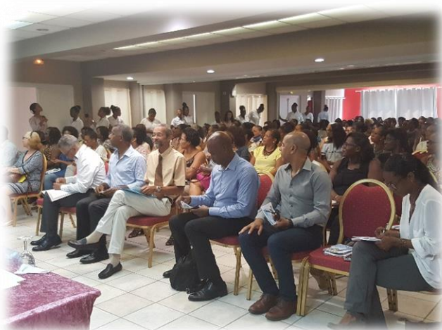
Ouverture : Plénière