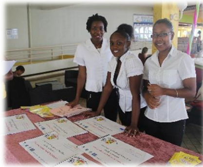
2 ème édition du Forum : Etudiants de la MFR à l'accueil