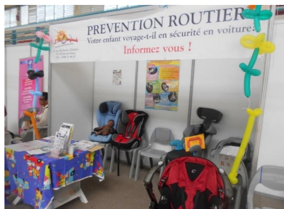
Stand : Île aux enfants sur la prévention routière