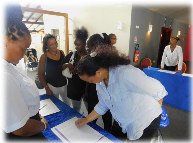
Accueil des invités : assuré par les étudiants et formateurs de la Maison Familiale et Rurale (MFR)