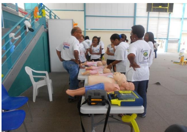
Stand : Association des secouristes Martiniquais